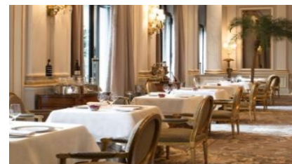
LES COULISSES DES GRANDS RESTAURANTS

nappage disposé sur les tables, le personnel repasse à nouveau le tissu afin d'effacer toutes les traces de pliage.