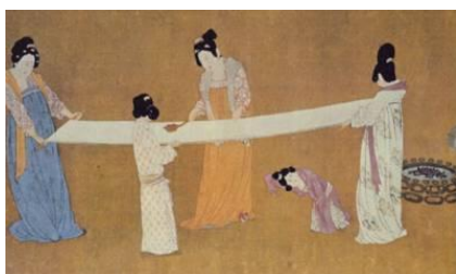
Femmes préparant la soie-Hui Tsung (1082-1135)

Ces fers "chinois" furent utilisés en Asie jusqu'au XIXe siècle.