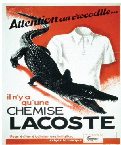
AFFICHE PUBLICITAIRE 1933

René Lacoste et André Gillier lancent la chemise polo Lacoste L.12.12 . Cette nouvelle chemise, fabriquée dans un tissu respirant et ornée du logo crocodile, est à la fois flexible et légère.